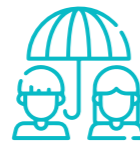
Personal del Sistema de protección de menores