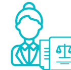
Abogados/as del Turno de Oficio de los Colegios de Abogados, de organizaciones especializadas y abogados/as particulares