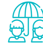
Personal del Sistema de protección de menores