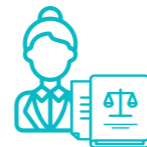
Abogados/as del Turno de Oficio de los Colegios de Abogados, de organizaciones especializadas y abogados/as particulares