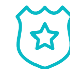
Policía nacional y policía local