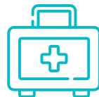
Personal del sistema nacional de salud