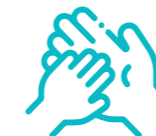
Organizaciones sociales que entren en contacto con los niños/as