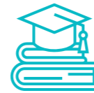
Personal de centros educativos