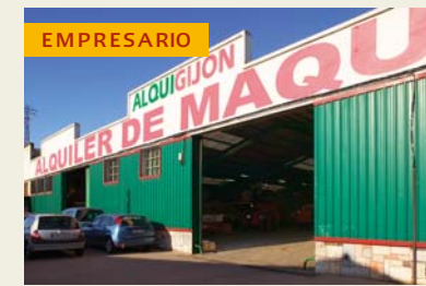
Fot. realizada en las instalaciones de ALQUIGIJÓN