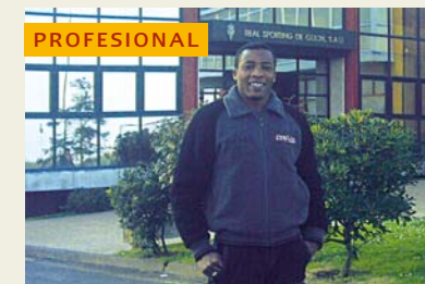
Fot. realizada en las instalaciones depor. de MAREO