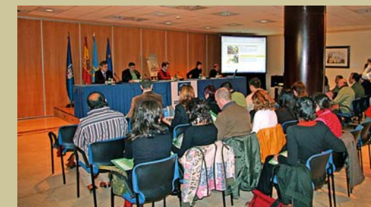
Presentación de la Campaña de Sensibilización. Febrero de 2006

Es un grupo de entidades e instituciones, Administración, asociaciones, sindicatos, ong's que intervienen de forma directa y/o transversal con el colectivo de inmigrantes que residen en Asturias, para la integración y promoción social de este colectivo en nuestra Comunidad Autónoma (salud, vivienda, educación, formación, empleo, etc...).