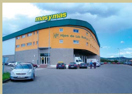
Supermercados masymas es una empresa de capital íntegro asturiano, fundada en 1932.

De profesión taxista, a su llegada a España consigue optar a una formación de soldador que le ha supuesto el trampolín para acceder a su primer empleo como soldador. Desde el mes de noviembre del 2006 desarrolla sus competencias socio-profesionales en la empresa Ingeniería y Diseño Europeo S.A. Y, como tantos otros trabajadores/as, en su día a día tiene que trasladarse de su lugar habitual de residencia, Gijón, a las instalaciones de la empresa ubicadas en Avilés. Esta nueva situación le ha posibilitado tanto ampliar sus conocimientos y aptitudes como mejorar su situación socio-económica.